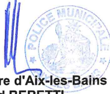
Le Maire d'Aix-les-Bains Renaud BERETTI